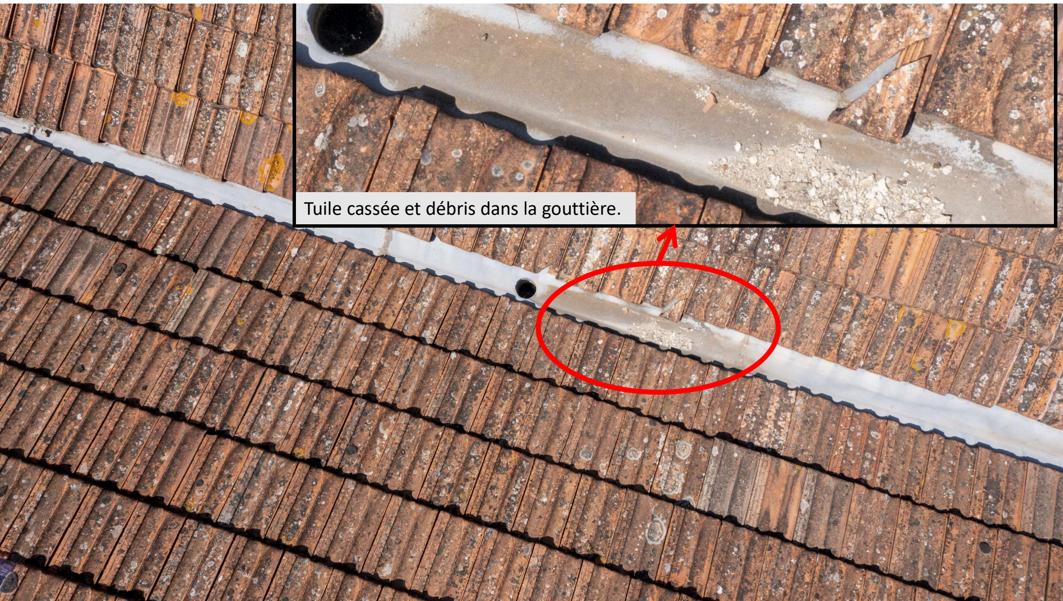
Tuile cassée et débris dans la gouttière.