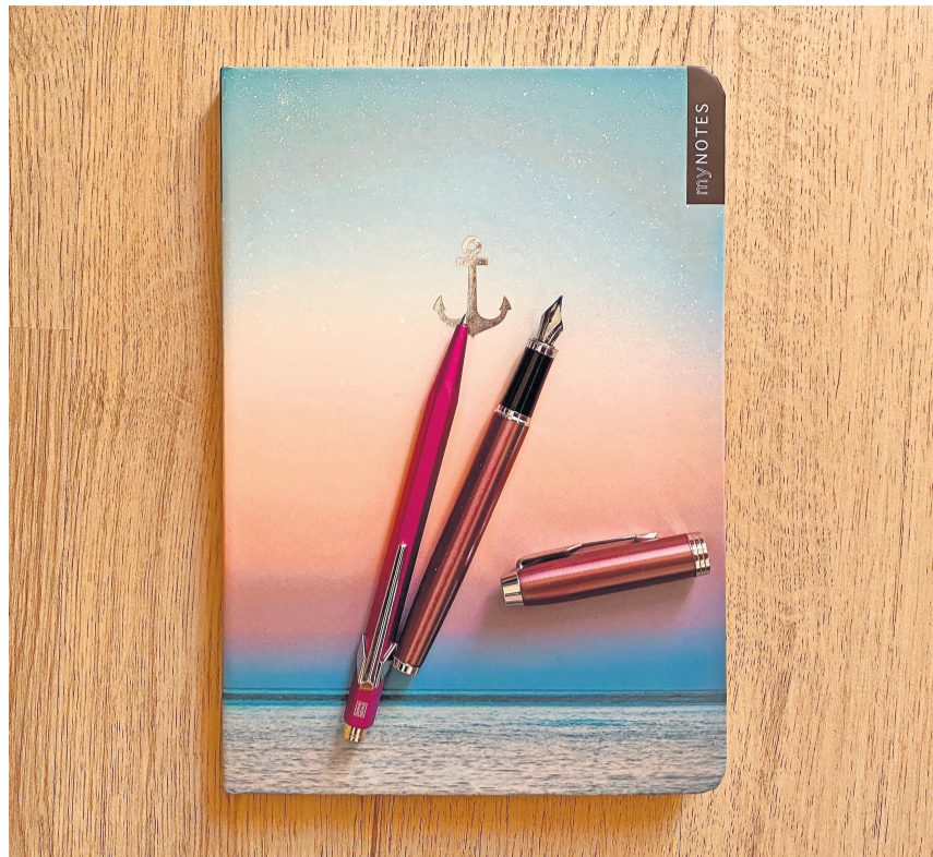
Worte mit Wirkung: den eigenen Nachruf schreiben.

Der Workshop steht allen offen; es ist nicht erforderlich, speziell schreibge-