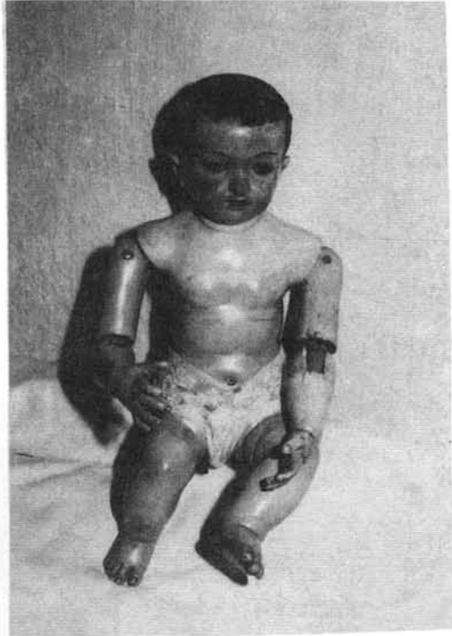
Niño de Nochebuena.