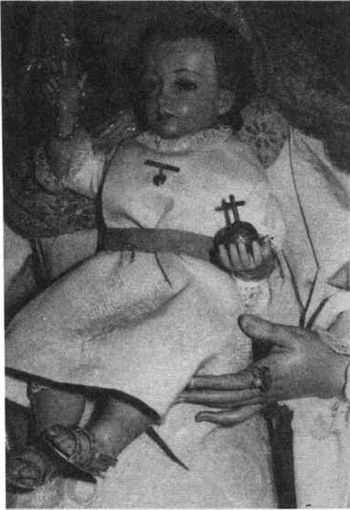
Niño de la Virgen.