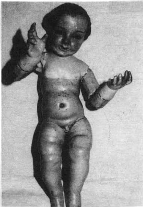
Niño de las Demandas.