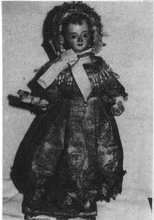
Pastorcillo. (Fotos del autor).