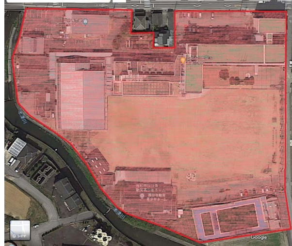
国分寺南部小学校と南部コミュニティセンターの喫煙範囲（赤枠内全て）