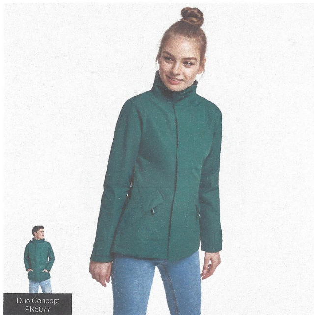
Duo Concept PK5077