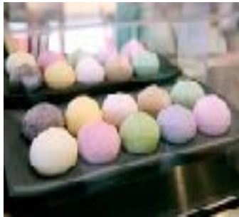
ICE CREAM MOCHI 2 st. 7.00 GRÜNTEE/VANILLE/PASSIONSFRUCHT ERDBEERE/MANGO/SCHOKOLADE/KIRSCHKE