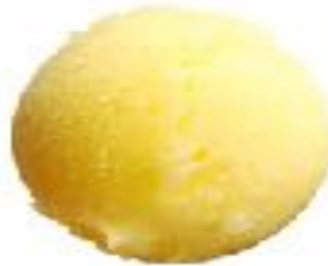
MATCHA EIS 4.00 SCHWARZES SESAM EIS 4.00 YUZU SORBET 4.00

Bei Fragen zu Allergien und Intoleranzen geben Dir unsere Mitarbeitenden gerne Auskunft.