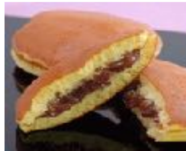
DORAYKI 2st. 8.00 Pfannkuchen mit Azuki Bohnen