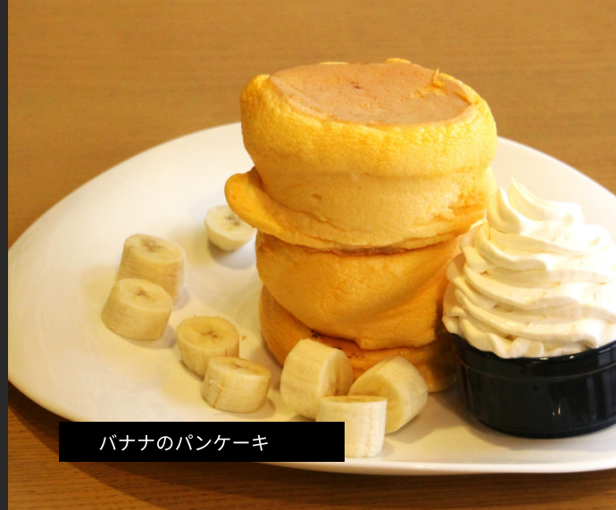
バナナのパンケーキ