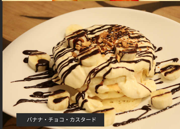
バナナ・チョコ・カスタード