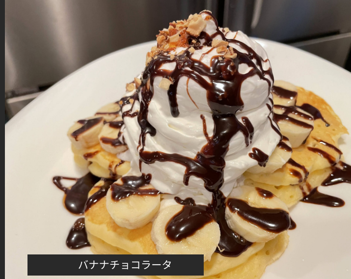
バナナチョコラータ