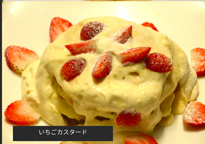
いちごカスタード