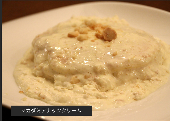
マカダミアナッツクリーム