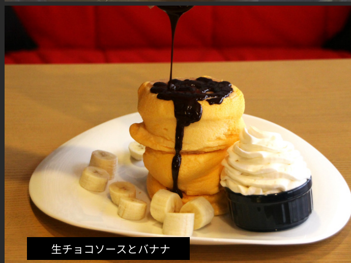
生チョコソースとバナナ