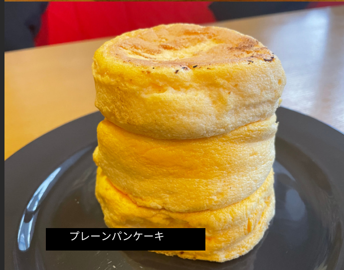
プレーンパンケーキ