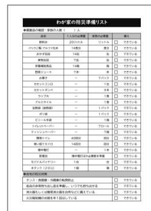
わが家の防災準備リスト