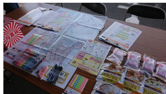
わが家の避難計画作成コーナー