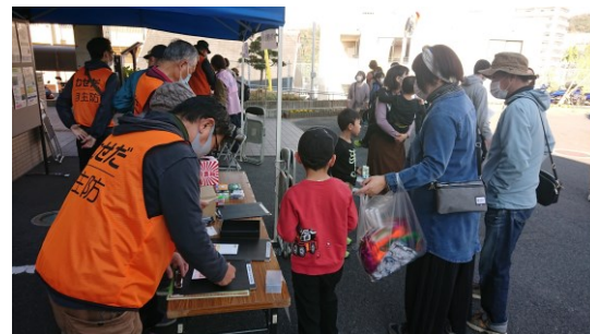
イベント実施状況