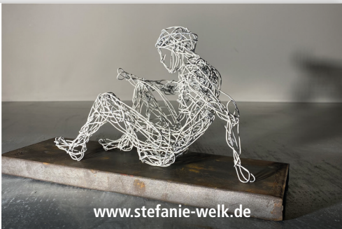
Stefanie Welk IN BETWEEN, 2024