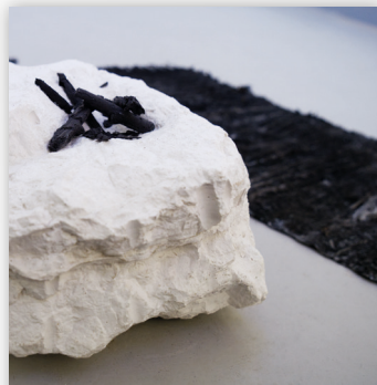
Aron Herdrich „living room“, 2023 Detailansicht