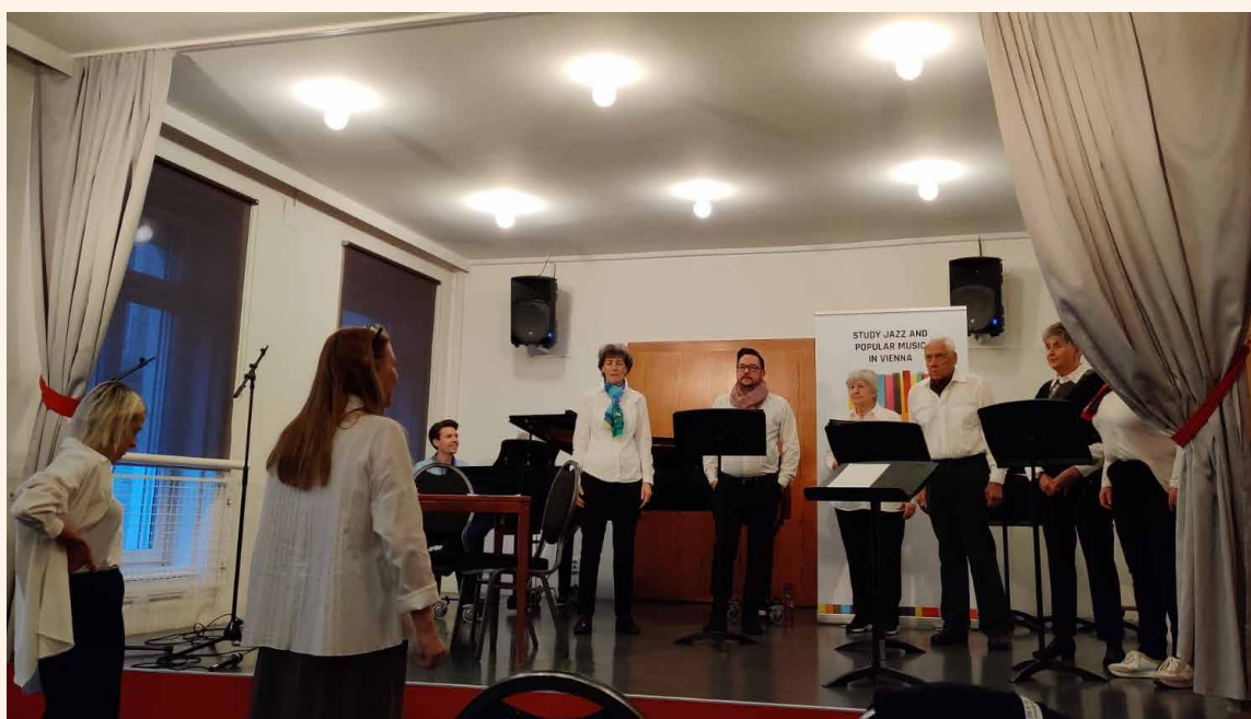
Abb. 2: SiAcO Chor - Generalprobe

unsere Sprechorgane fähig, viele verschiedene Laute zu produzieren. Eine gute Kommunikation hängt von einer präzisen Artikulation ab. Für die deutsche Sprache gilt es, eine relativ hohe Artikulationsspannung zu entwickeln. Die richtige Einstellung und Bewegung von Lippen, Kiefer, Zunge und Gaumensegel, ihr ständiges Wechselspiel und Ineinandergreifen von Spannung, Abspannung und Lösung sind die Grundlagen für die Lautbildung. Das Ansatzrohr besitzt als Resonator die Funktion des Klangfilters. Die Entstehung der Formanten durch Verstärkung von Teiltönen führt zur spezifischen Klangfärbung einer Stimme. Bei der Entstehung von Vokalen sorgt die jeweilige Verformung des Ansatzrohres dafür, dass weitere Teiltöne verstärkt werden – diese Formanten sind spezifisch für den Klang des jeweiligen Vokals (Bergauer & Janknecht, 2011). Dies konnten die Studienteilnehmer_innen mittels „Plastischer Artikulation“ nach Coblenzer erlernen. Der dazu verwendete Korken diente dazu, die Artikulation besser auszuformen, diese nach vorne zu verlagern und somit im »