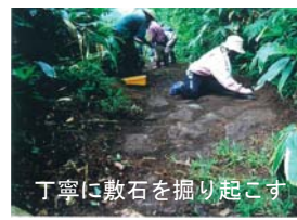
丁寧に敷石を掘り起こす