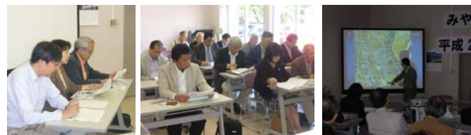
(参考) 記念講演会内容