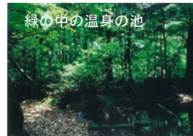
緑の中の温身の池