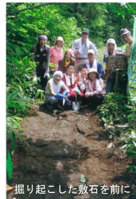
掘り起こした敷石を前に

3回目の今年は、新たに『プラスあるふあ楽イベント(温泉宿泊交流そして温見平ブナの原生林散策ツアー)』が盛り込まれ、2日間の日程で開催されました。