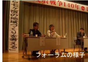
フォーラムの様子