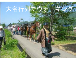
大名行列でウォーキング