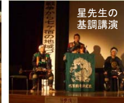
星先生の基調講演