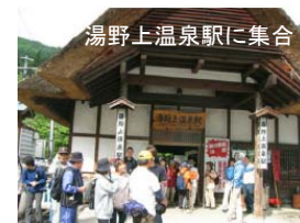
湯野上温泉駅に集合

ふくしまけん街道交流会「in たじま・御蔵入」の翌日、太閤秀吉やイザベラ・バードも辿った「下野街道」を歩きました。