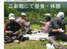
三彩館にて昼食・休憩