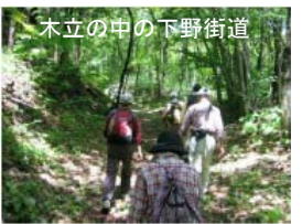
木立の中の下野街道