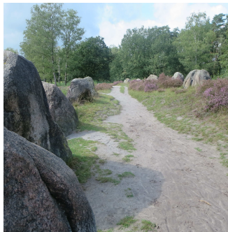
Glaner Braut 50m X 8m

Wir fahren zu den als „Glaner Braut“ bezeichneten Großsteingräbern. Die Gräber befinden sich in einer als Naturschutzgebiet ausgewiesener Heidelandschaft. Es handelt sich um drei Gräber. Die größte Anlage hat die Abmessungen von 50 m x 8 m. Das nur wenige Meter entfernte 2. Grab hat die Abmessungen von 30 m X 5 m. Die Grabkammer ist gut erhalten. Die Wandsteine sind vollzählig.