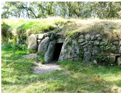
Grab bei Kleinenkneten

Am Nachmittag besuchen wir die Großen Steine von Kleinenkneten. Sie