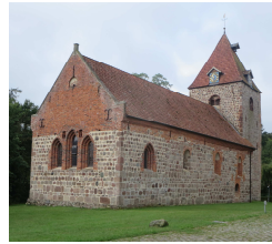
Kirche St. Firminus

Unser Rundgang beginnt am Hotel und führt uns vorbei an Fachwerkhäusern bis zur 1000 jährigen Dorfeiche. Nicht weit davon befindet sich die mittelalterliche Feldsteinkirche St. Firminus. Firminus, der Ältere, war im 3.Jh. der erste Bischof von Amiens (Frankreich) und in der Christenbekehrung tätig. Im Innern der Kirche befinden sich Ornamentmalereien mit Lebensbaumdarstellungen.