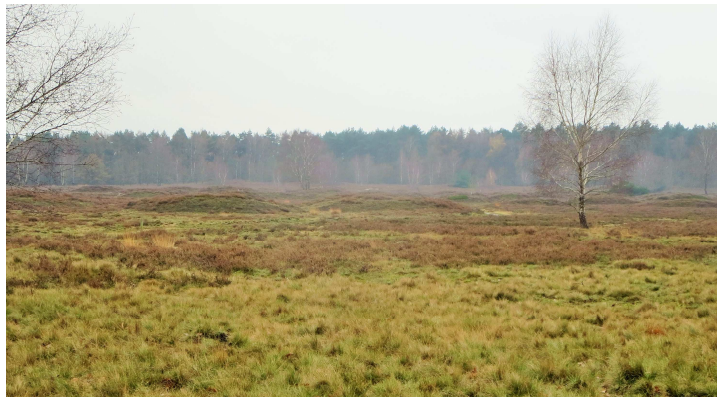
Teilansicht vom Pestruper Gräberfeld

Der Vortrag handelt von Bestattungsriten in der Zeit der Bronze- und Eisenzeit. Bis zu den Anfängen der nachchristlichen Zeit.