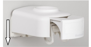
3. Wandhalterung entfernen (bei geöffnetem Schieber nach unten drücken)