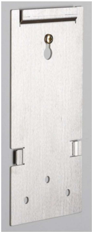
1. CNS-Wandhalterung oben mit Schraube anschrauben (Rundkopfschraube Ø 5 mm)