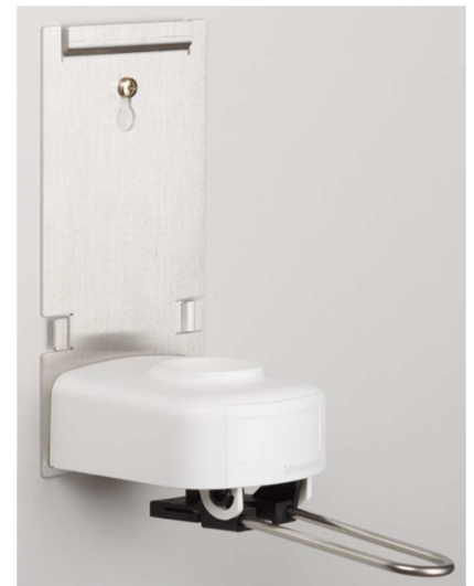
6. Schieber schliessen