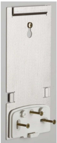
4. Wandhalterung anschrauben (Senkkopfschr. Ø 4.0 mm)