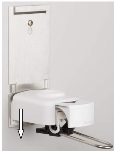
5. Spender mit geöffnetem Schieber aufstecken + ev. Armhebel einsetzen (ganz nach unten drücken)