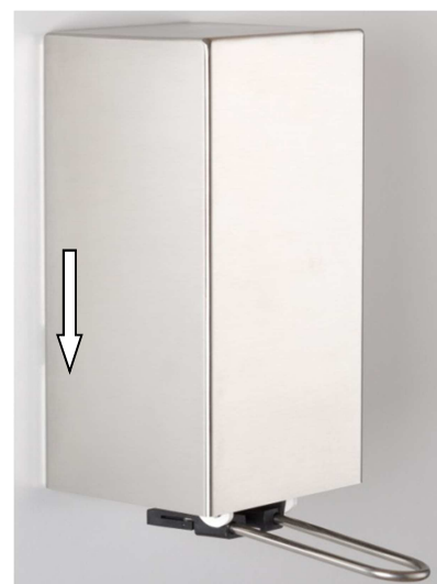
7. CNS-Abdeckung aufstecken (ganz nach unten schieben)

Achtung: Adapter nicht ohne Flasche einsetzen!