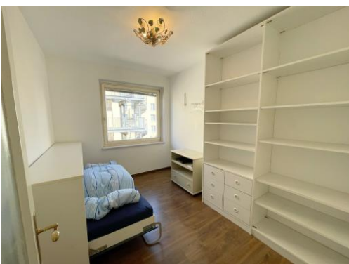
Das Ankleide- und Besucherzimmer