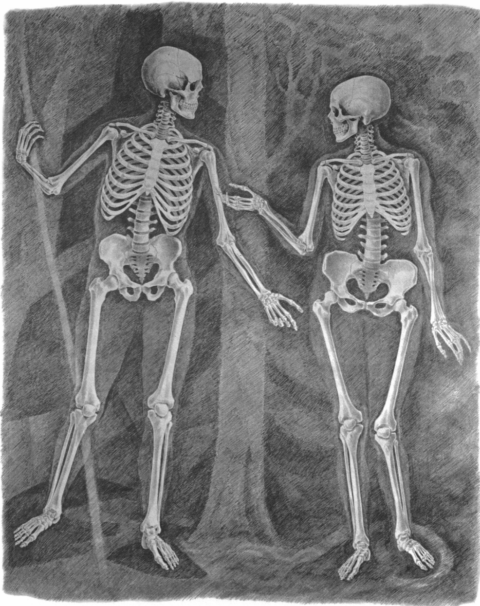
Zeichnung von Alfred Stolle

Drittes Beispiel: Künstlerisch gesehen zeigt der menschliche Leib eine Kugeltendenz im Kopf, eine Strahlentendenz in den Gliedmaßen und eine Synthese der beiden in der Brust. Das bewahrheitet sich in allen Einzelheiten und führt zu immer mehr Entdeckungen! So leuchtet der Wandel von Rippe zu Rippe ein, die Ringe oben eng geschlossen, nach unten sich öffnend und weitend.