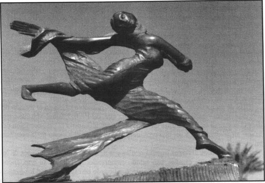
Iris (Mensajera de los dioses). Madera de caoba (Venezuela).