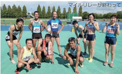
マイルリレーが終わって