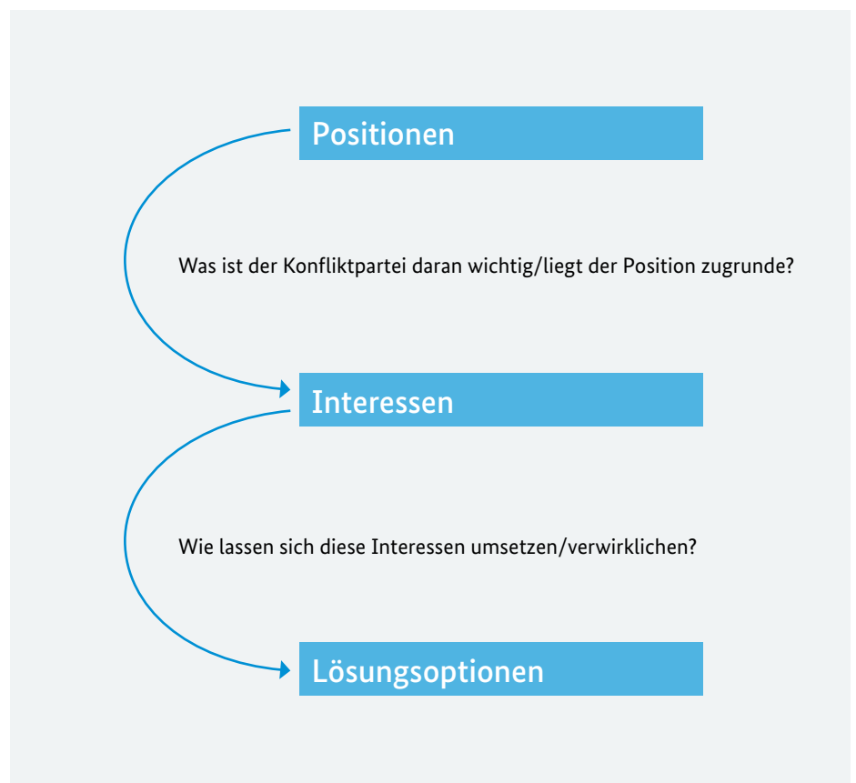
Abb.: Unterscheidung von Position, Interessen und Optionen (Europa-Universität Viadrina)

Interessen müssen so verfasst sein, dass ihre Formulierung Verständnis und Lösungskreativität fördert, indem sie u. a. die Fixierung auf bestimmte, gegeneinanderstehende Positionen auflöst. Zugleich müssen Interessen konkret genug formuliert sein, um als Bewertungsmaßstab für Lösungsoptionen zu dienen.