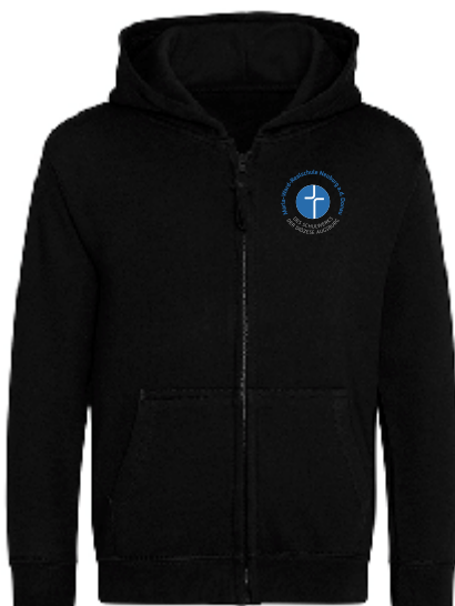
Farbe: deep black