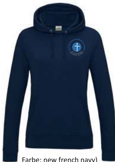
Farbe: new french navy