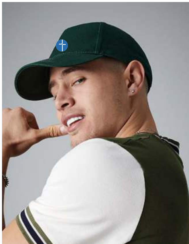
Farbe: bottle green, Stick: white

Ich bin ein 5-Panel Cap und werde mit einem Stick veredelt.