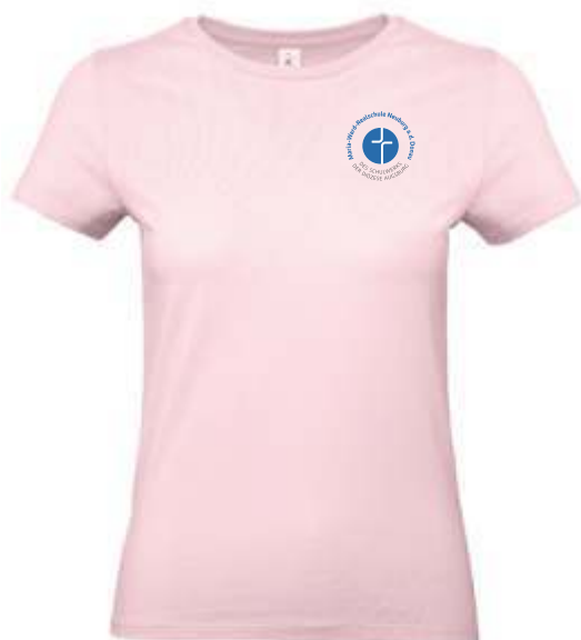
Farbe: orchid pink