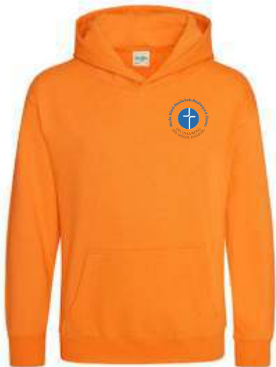
Farbe: orange crush