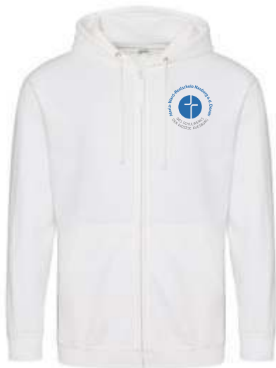
Farbe: arctic white