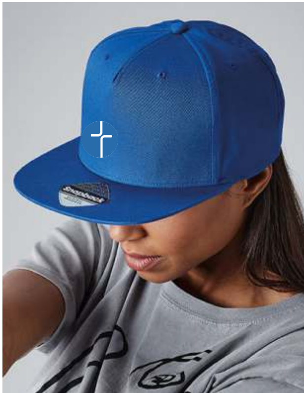
Farbe: bright royal, Stick: white

Ich bin ein 5-Panel Snapback Rapper Cap und werde mit einem Stick veredelt.