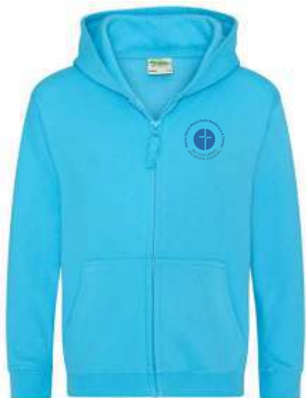
Farbe: hawaiian blue