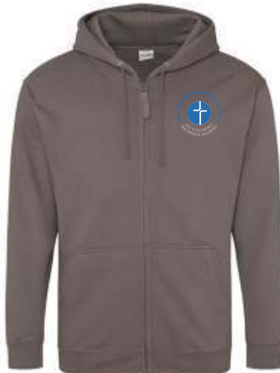
Farbe: steel grey