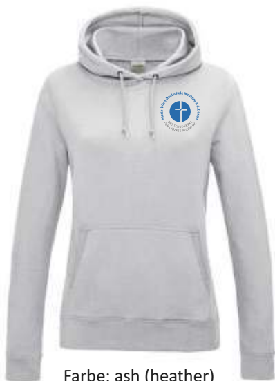
Farbe: ash (heather)