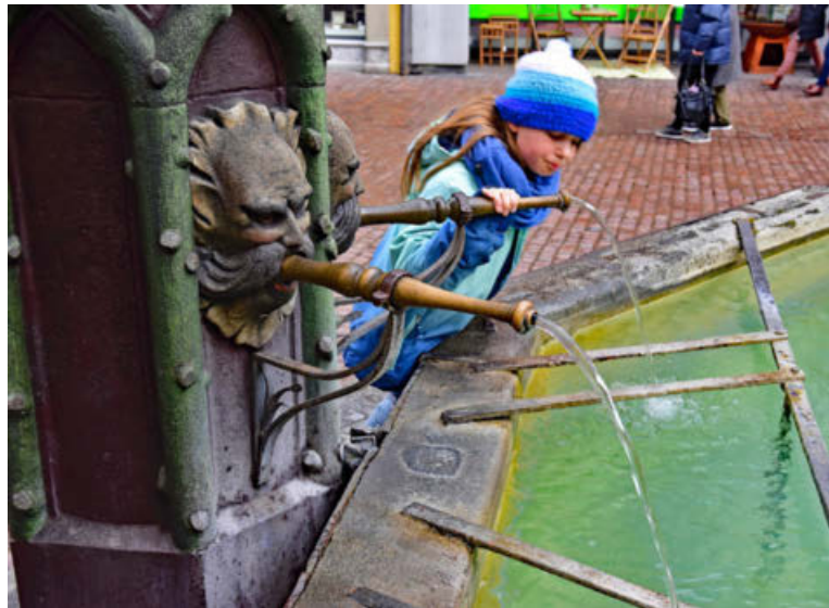
Trinkwasser ist ein wertvolles Gut.