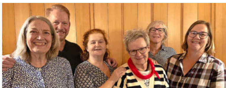
Der Vorstand mit dem Chorleiter des Frauenchors Illnau.