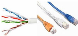
LAN-Kabel (8 Litzen)