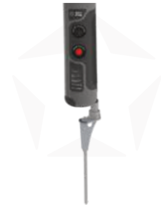
ERDDORN MIT ROTATOR

OPTIONAL SANDGEFÜLLTE GEWICHTE ZUR ERHÖHUNG DER STABILITÄT DES KREUZFUSSSES. ERHÄLTLICH IN VERSCHIEDENEN VARIANTEN FÜR JEDES STARX FAHNENMODELL.