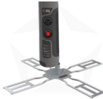
KREUZFUSS MIT ROTATOR

SCHWENKFUSS FÜR DIE VERWENDUNG MIT FAHRZEUGEN. EINFACH AUF DIE BASIS MIT DEM RAD EINES AUTOS FAHREN, UND SO EINE STABILE UND WIRKSAME POSITION DER FAHNE ERHALTEN.