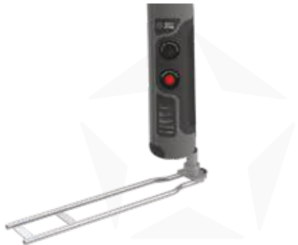
AUTOSTELLFUSS MIT ROTATOR

DANK EINER VIELFALT VON STELLFUSSBASEN KÖNNEN STARX FLAGS AUF DEN VERSCHIEDENSTEN UNTERGRÜNDEN VERWENDET WERDEN.