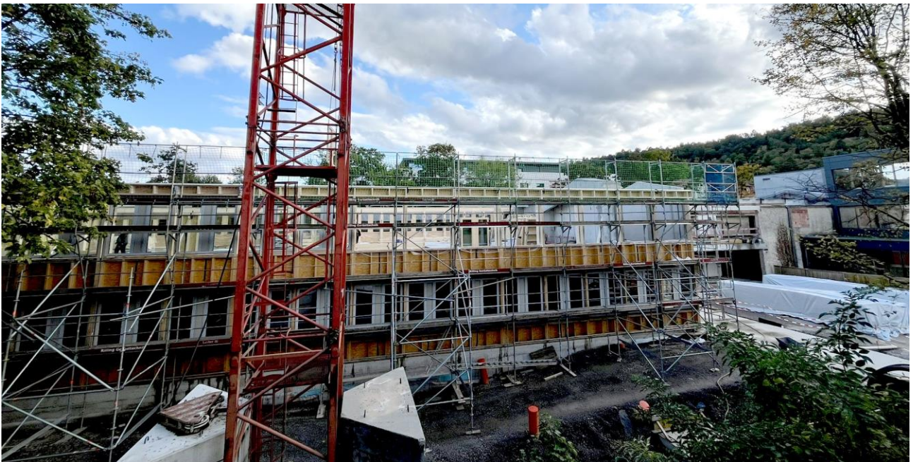
Aktueller Blick auf die Baustelle: Der Erweiterungsbau nimmt Gestalt an!