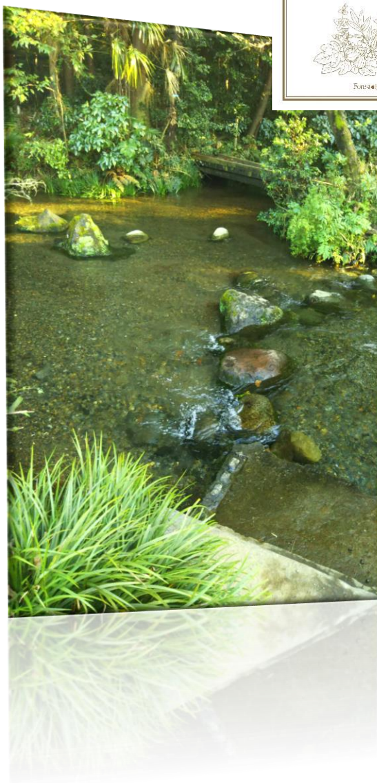
十月の落合川 齊藤裕子