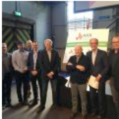
171 KB jpg Branchedag NHK2