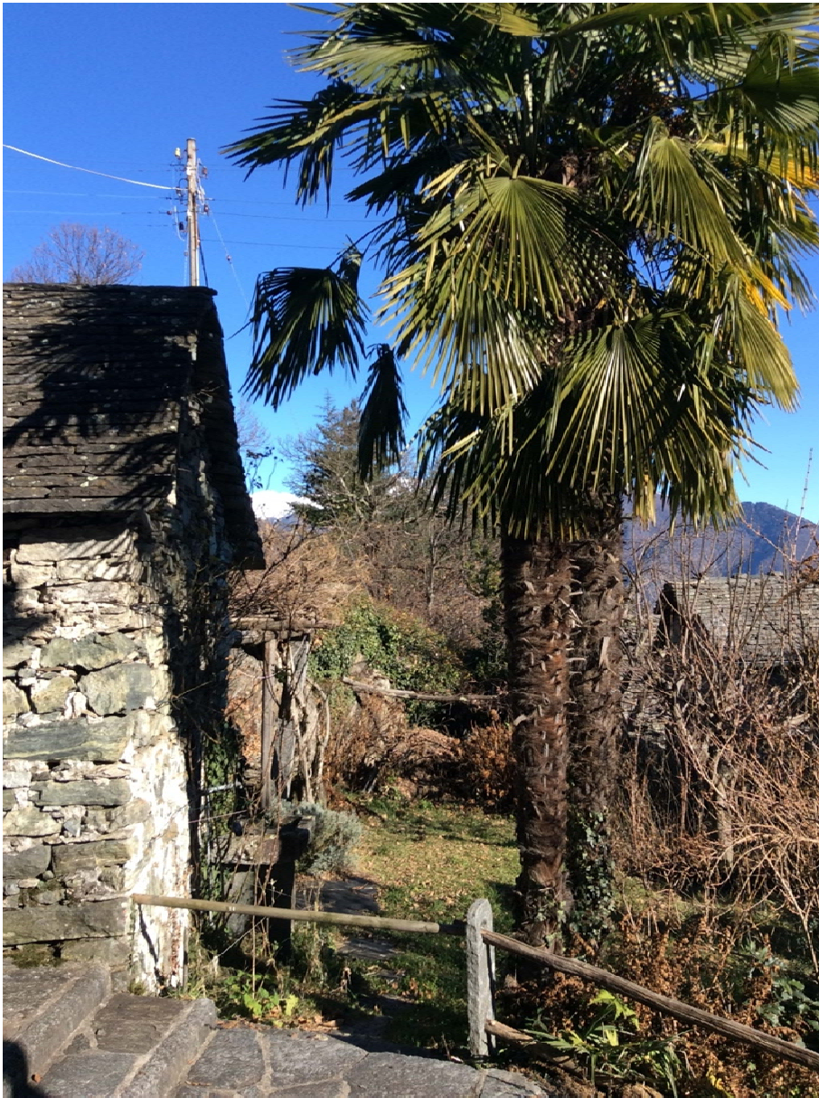
Blick aus dem Fenster