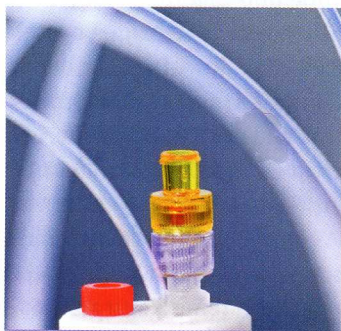
Die Technik findet, was die Nase des Parfumeurs (rechts oben) ahnte.