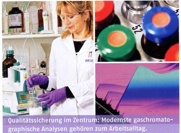
Qualitätssicherung im Zentrum: Modernste gaschromatographische Analysen gehören zum Arbeitsalltag.

Die Reinheit der Öle: Bedenkt man, dass ein Liter ätherisches Rosenöl in der Antike mit Gold aufgewogen wurde und der Preis heute je nach Qualität bis zu 8000 Schweizer Franken pro Kilo betragen kann, so versteht man, dass die Versuchsung, billige Rohstoffe beizumischen, gross ist. So kann es vorkommen, dass Hersteller