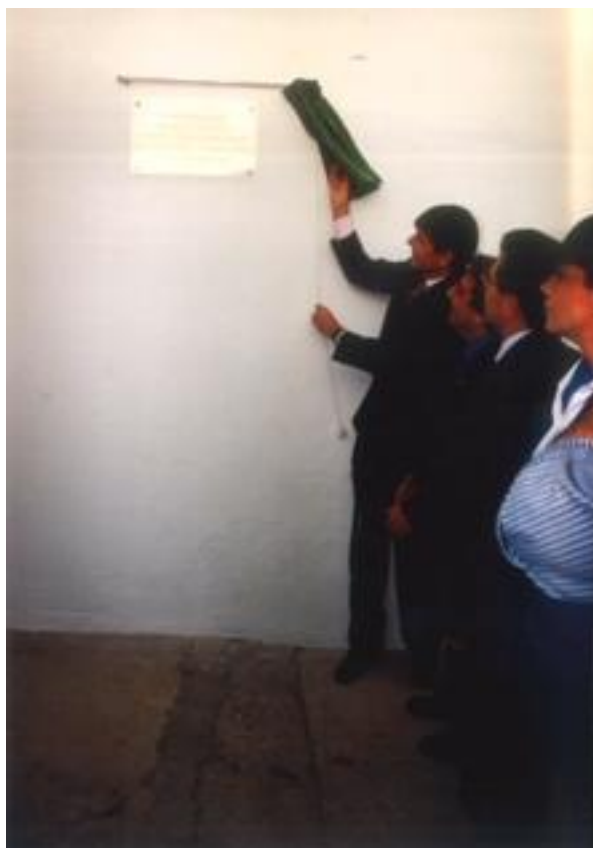
Foto 5. Inauguración de las nuevas instalaciones de la bodega vieja con el Ministro D. Manuel Pimentel, el Rector Eugenio Domínguez y Manuel Pineda

En la campaña 1999-2000 realizó el equipamiento de la bodega vieja con voluminosos depósitos de acero para el aceite. Las nuevas instalaciones fueron inauguradas por el entonces Ministro de Trabajo, D. Manuel Pimentel (Foto 5).