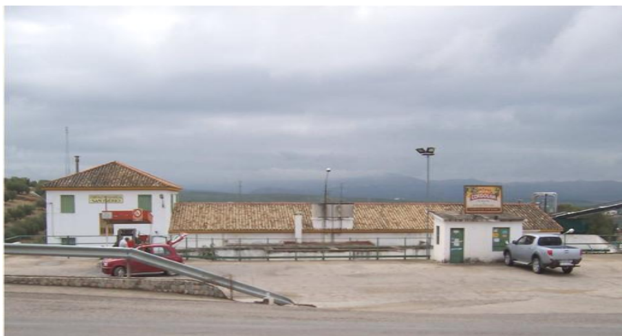
Fotos 2 y 3. La Cooperativa de San Isidro de Espejo en 1960 y en la actualidad