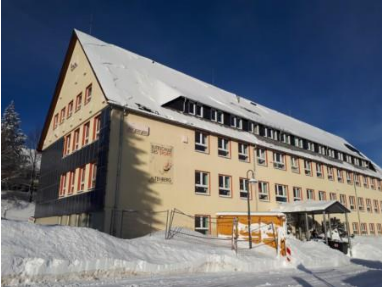
„Glückauf“- Gymnasium Dippoldiswalde/Altenberg