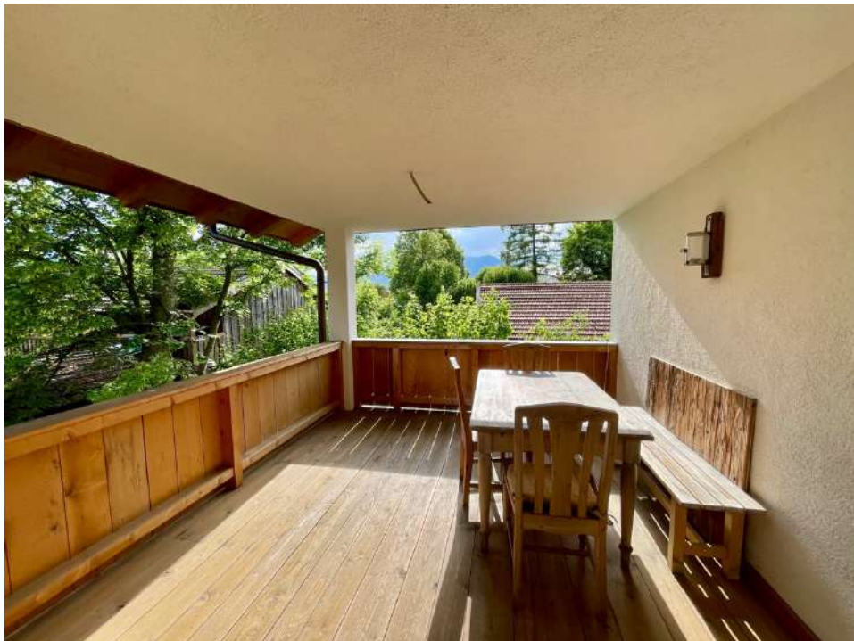
Herrlicher Freisitz nach Süden und Westen