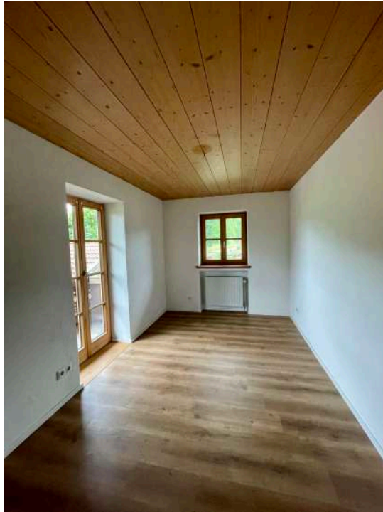
Weiteres Schlafzimmer nach Osten