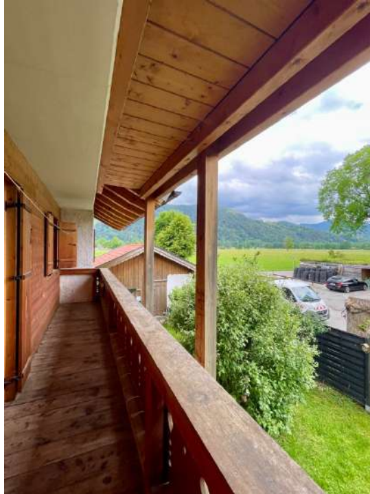
Balkon nach Süden mit Bergblick