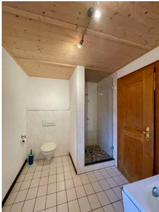
Renoviertes Dusch- und...