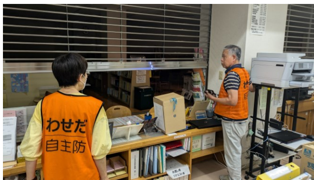
公民館事務室の閉鎖方法の確認