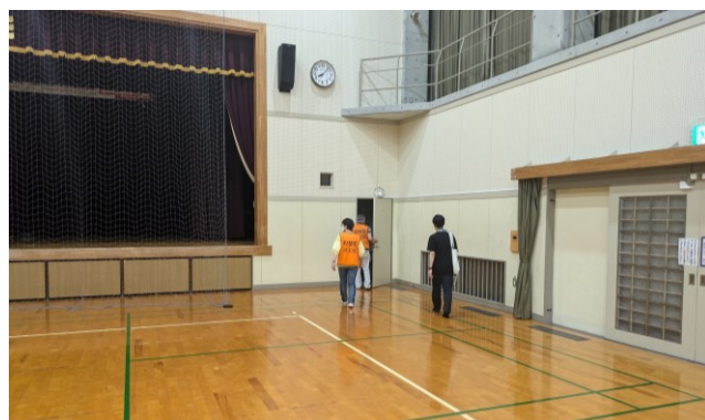
ホールの開設方法の確認