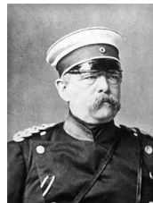
Otto von Bismarck (1815-1898)

Fils du roi Charles-Albert de Sardaigne, il devient roi de Sardaigne à partir de 1849 et fait de Cavour son Premier ministre à partir de 1852. Grâce à un accord secret entre Cavour et Napoléon III, Victor Emmanuel II devient « roi d'Italie » en 1861. Il soutient l'unité italienne et fait de Rome sa capitale.