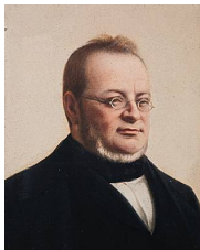
Camillo Cavour (1810-1861)

Issu de la noblesse, il milite pour faire de la Sardaigne une monarchie constitutionnelle. Premier ministre du roi de Sardaigne de 1852 à 1861, il se rallie à l'idée d'une unité italienne autour du Piémont. Il passe un accord secret avec la France permettant à Victor Emmanuel II d'être proclamé roi d'Italie.