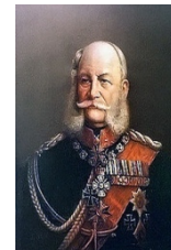
Guillaume I er (1797-1888)

Issu de la noblesse, il est élu député en 1847 et soutient la répression de 1848-1849. Il est nommé chef du gouvernement prussien par Guillaume I er en 1861. Grâce à ses victoires, il est l'artisan de l'unité allemande. Il est chancelier du Reich jusqu'à son renvoi en 1890 par l'Empereur Guillaume II.