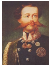
Victor Emmanuel II (1820-1878)

Issu de la noblesse, il milite pour faire de la Sardaigne une monarchie constitutionnelle. Premier ministre du roi de Sardaigne de 1852 à 1861, il se rallie à l'idée d'une unité italienne autour du Piémont. Il passe un accord secret avec la France permettant à Victor Emmanuel II d'être proclamé roi d'Italie.