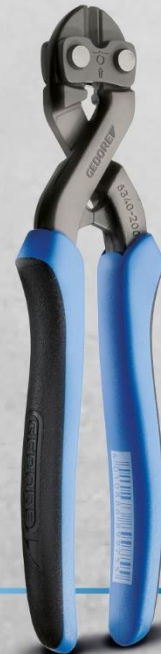
2541300 BOLZENSCHNEIDER 200 mm