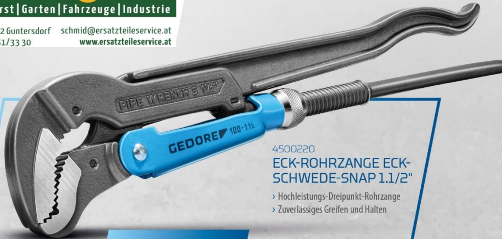
4500220 ECK-ROHRZANGE ECK-SCHWEDE-SNAP 1.1/2" › Hochleistungs-Dreipunkt-Rohrzange › Zuverlässiges Greifen und Halten

Grund 87 | 2042 Guntersdorf schmid@ersatzteileservice.at Tel. +43(0)2951/33 30 www.ersatzteileservice.at