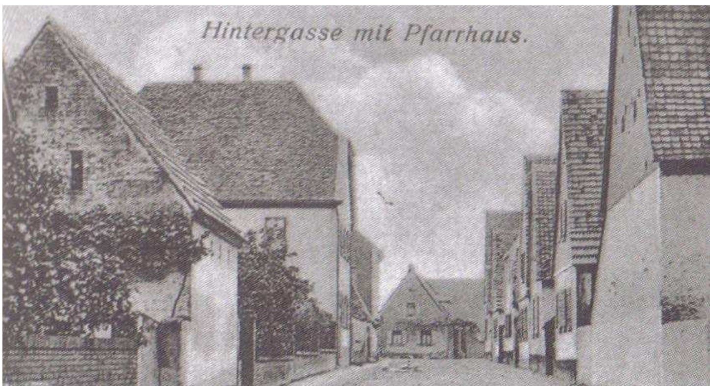
Die Hintergasse, heute Raiffeisenstraße, von der Neustadter Straße aus gesehen vor dem 7. Dezember 1918. Auf der linken Seite das Pfarrhaus.

Der Garten des Pfarrhauses deckt sich vermutlich mit der Lage des Friedhofs, der bis 1770 als Kirchhof die erste Kirche umgab, danach in die Neustadter Straße verlegt und erst nach 1820 am heutigen Ort angelegt wurde.