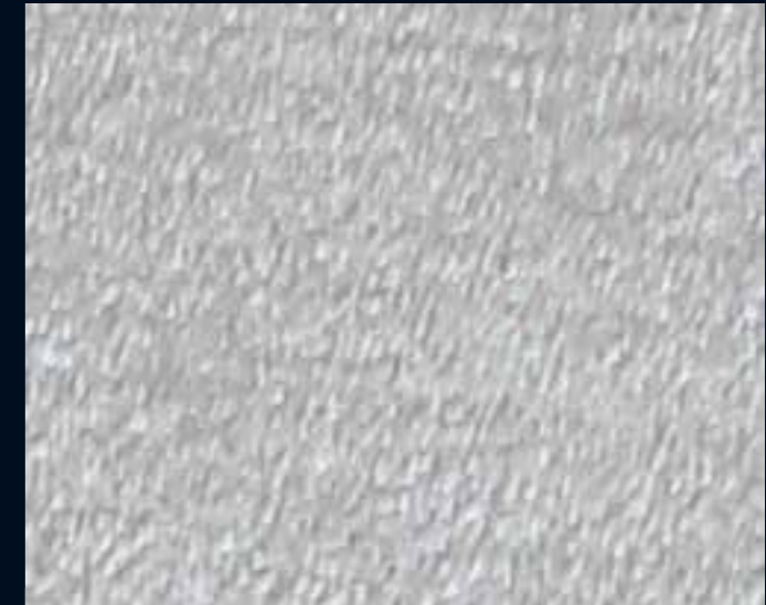
FILE' MICRO ARGENTO