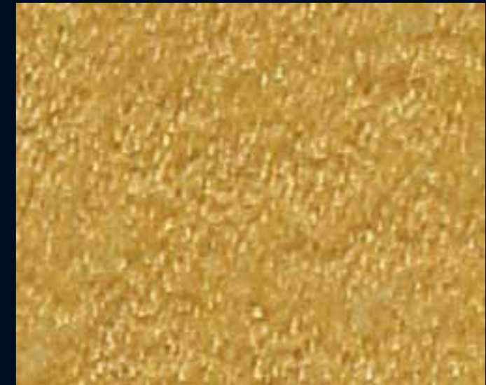
FILE' MICRO ORO