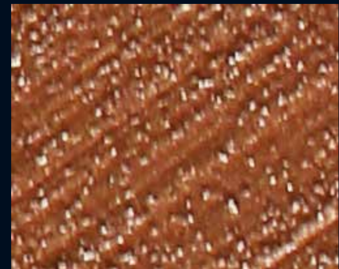
FILE' METAL BRONZO