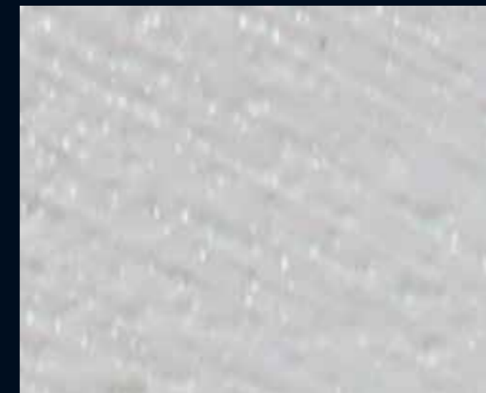
FILE' METAL INTER ORO