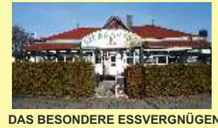
DAS BESONDERE ESSVERGNÜGEN