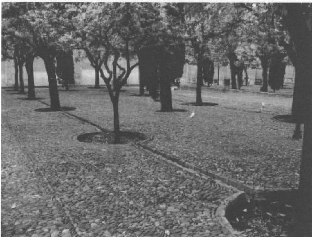
Figura 3. Riego por alcorques. Patio de los Naranjos. Mezquita de Córdoba.

Según otros autores (Cherif Jah y López Gómez, 1994), también hay que regar las plantas cuyas raíces quedan al descubierto. En cambio, a las plantas débiles no hay que darle mucho riego. El agua estancada por un tiempo se estima que es perjudicial para los árboles que no son frutales.