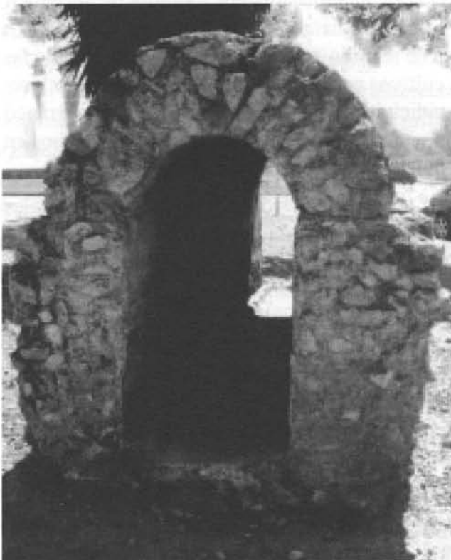
Figura 1. Tramo del acueducto romano de Valdepuentes (siglo I reutilizado en el S. X para el abastecimiento de aguas a la ciudad de Medina Azahara)

De hecho, el uso agrícola del agua, con frecuencia asociado en los textos escritos a la existencia de huertas y jardines, contribuyó, como decíamos al principio, a mejorar los rendimientos. La producción alcanzó un notable desarrollo en las zonas periurbanas. Las referencias a estos espacios agrícolas suburbanos son muy frecuentes en las descripciones geográficas, que abundan en testimonios de la feracidad de los contornos de las ciudades (Manzano, 1986), donde se advierte la existencia de unidades de explotación agrícola, denominadas en las fuentes árabes con términos distintos (García Sánchez, 1996). Una de ellas, la almunia, proliferó en los alrededores de la Córdoba califal, hasta alcanzar, según información escrita, un total de unas quince o más; en algunas de ellas, como en la denominada Arruzafa, había áreas de experimentación agrícola, en las que se aclimataban nuevas especies o se mejoraban otras ya existentes en el suelo peninsular. En esa almunia, Abdarrahan I "formó un hermosísimo jardín con toda clase de plantas raras y exóticas y hermosos árboles de todos los países, tratando de que tuvieran agua para su riego" (Arjona, 1982).