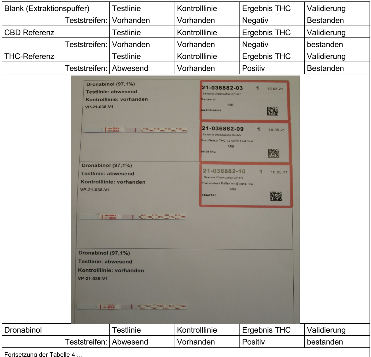
Tabelle 4: Ergebnisse der Validierungsexperimente

Die Validierungsergebnisse werden in der folgenden Tabelle dargestellt.