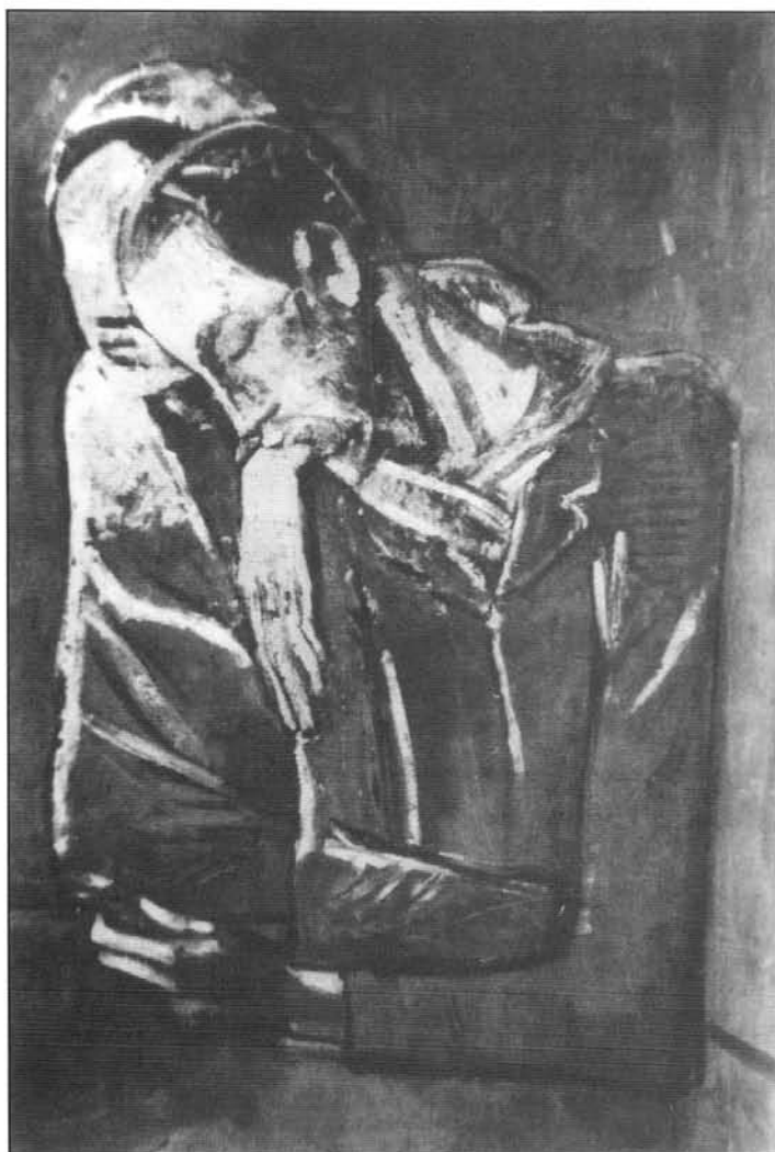
Fig. 6 La pareja . Picasso. Colección Privada. Acsona.

Ya en nuestros días otro pintor del dolor, de la desesperación y de la angustia, el ecuatoriano Oswaldo Guayasamín, nos ofrecía en su exposición Huacayñán , que quiere decir “el camino del llanto”, entre cuadros de feroz realismo que denuncian los sufrimientos de esa Hispanoamérica doliente e irredenta, el tema de la enfermedad y la pobreza.