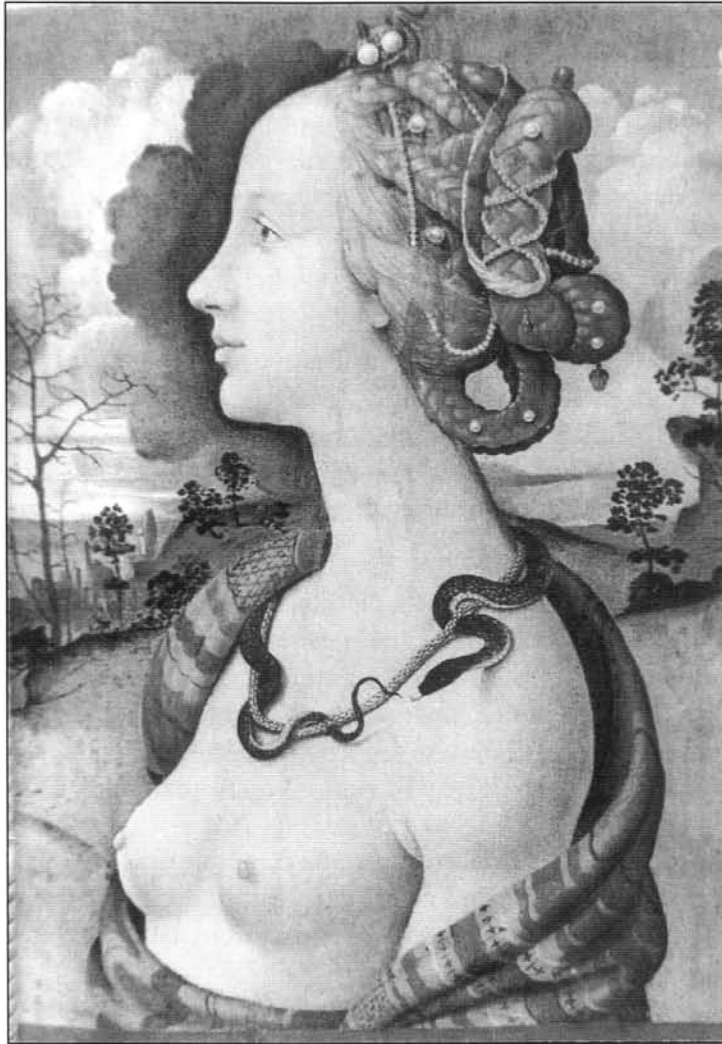
Fig. 1 Simonetta Vespucci. Piero Di Cósimo. Museo Condée. Chantully.