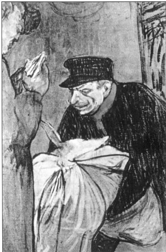
Fig. 4 El lavandero de la Casa . Toulouse Lautrec. Museo de Acbi.

En las hermanas Brönte ya empezamos a encontrar la otra cara de la tisis, triste, patética, angustiosa...; la que pudieron constatar cientos de miles de personas a lo largo de la historia de la humanidad: la fiebre, la tos, la hemoptisis, la disnea, la consunción, la muerte... La que comprobó Molière, el gran satírico, cuando compuso su "requiem", El enfermo imaginario , al sentirse morir y en el que parece querer vengarse de la medicina y los médicos que no supieron curarle. O la que vio Chopin el día antes de su fallecimiento, cuando tras una agudísima crisis de disnea, exigió: "...puesto que esta tierra ha de enterrarme, os conjuro para que hagais abrir mi cuerpo, para que no me entierren vivo...". O la reflejada en algunos cuadros impresionistas, como la delgadez angulosa y palidísima del rostro emaciado del filósofo de Montpellier, Alfredo Bruyas, que plasmara Coubert, o en el retrato de Victor Chouquet, de Renoir, en el que los ojos hundidos, los pómulos angulosos, las mejillas enteramente descarnadas, la frente amplia y sudorosa, todo, hasta la expresión entre resignada e irónica, resulta delatador en extremo (Figura 4). O la que Toulouse-Lautrec impacta en El lavandero en la