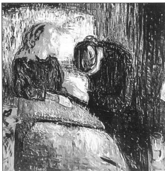
Fig. 5 La muchacha enferma. Edward Munch. Tate Gallery. Londres.

En su obra podemos encontrar una serie de cuadros que representan su autobiografía, cuadros en los que el dolor y la desesperación –su íntima tormenta– están siempre presentes; cuadros donde la enfermedad y la muerte laten en los colores potentes y francos y en los violentos contornos de las figuras; cuadros, que según Kurt Moldovan, constituyen una revelación angustiosa, violenta e intuitiva de la tisis (Figura 5).