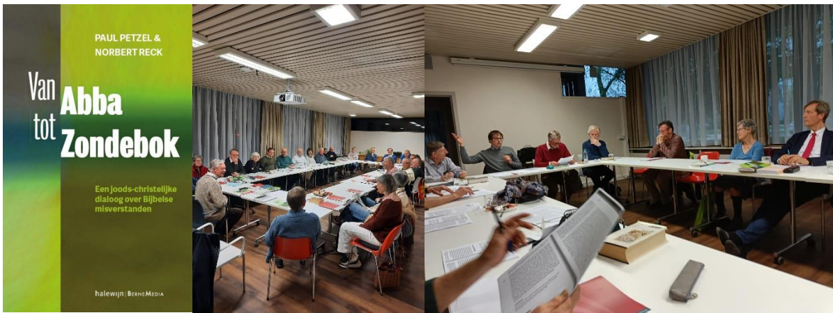
Uitgeverij halewijn / Berne Media ( € 24,95)