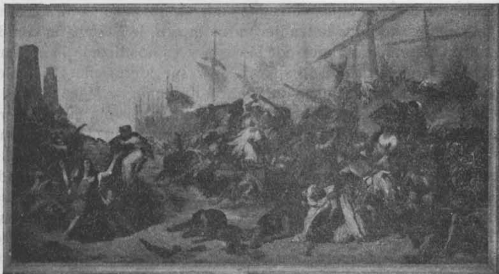
Alejandro Ferrant «Desembarco africano».- Museo de Cádiz.

a los primeros y abandonar el segundo, no es posible una defensa eficaz con tanta impedimenta, les dice, pero el señor de Albayda le contesta: «Acuérdate que eres bisnieto de Don Martín Alonso, el del buey cojo», lo que le decide a permitir aquella terrible columna de esclavos. Su bisabuelo en las talas en los campos granadinos en una ocasión entre las reses que había capturado había un buey cojo y cuando se quedaba rezagado y se apoderaban nuevamente de él