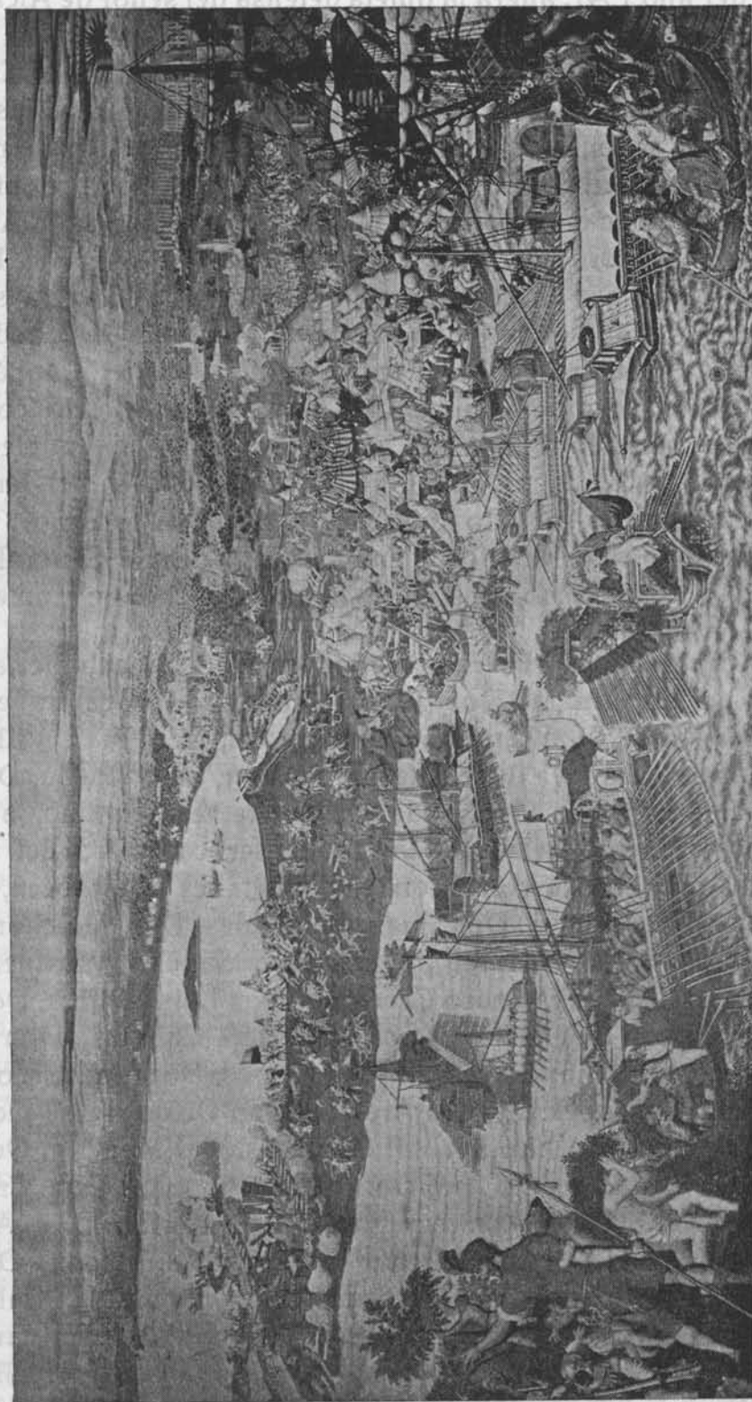
Vermeyen. «La conquista de Túnez». Tapiz del Palacio Real de Madrid.