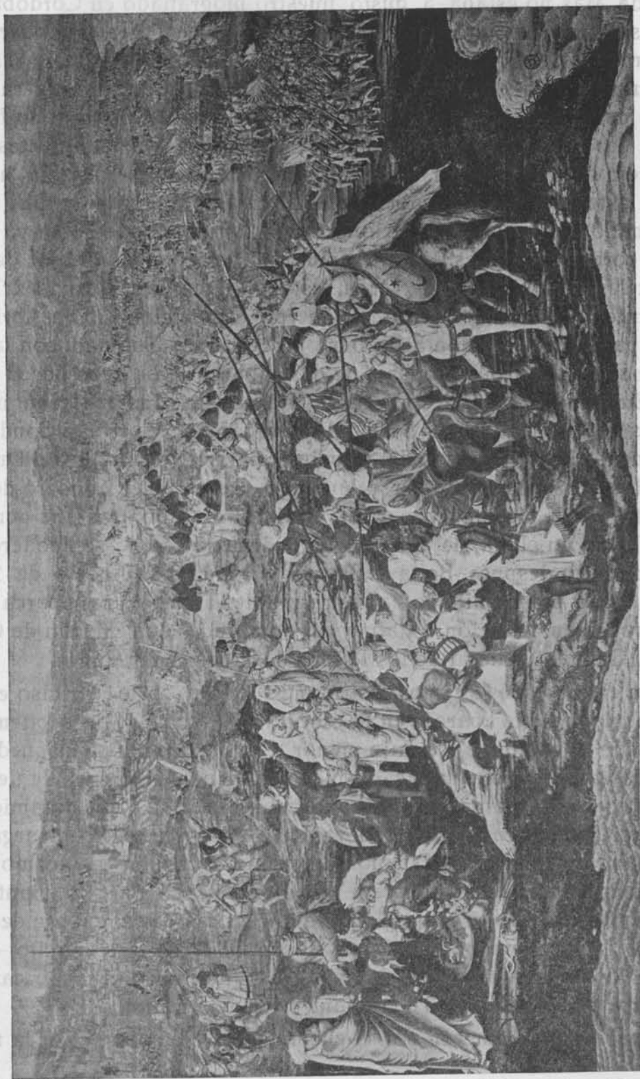
Vermeyen. •La conquista de Túnez».—Tapiz del Palacio Real de Madrid.