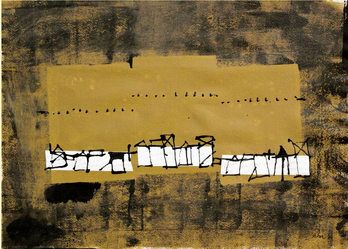
Molinos en orden de batalla , ©Jean-Pierre RODRIGO / 2000 Atelier de l'artiste, Cahors

Voici une reproduction du tableau dans son intégralité :