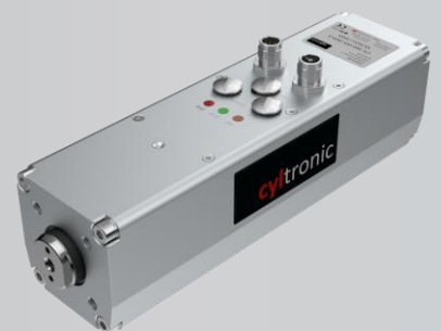
Cylinder CTC-_- I mit Innengewinde