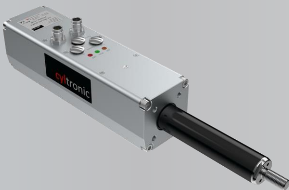
Cylinder CTC-_- A mit Aussengewinde

unterschiedliche Anforderungen vielseitige Möglichkeiten