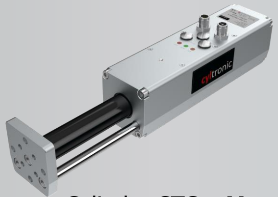
Cylinder CTC-_- V mit integrierten Rundführungen und Endplatte