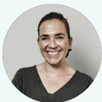
Bea en Madrid

EN EL MUNDO DE LA EMPRESA, LO RECOGE TODO UN RELATO CORPORATIVO BIEN DISEÑADO. PÍDENOS MÁS INFORMACIÓN Y TE AYUDAMOS A ADAPTAR EL PROCESO A TU REALIDAD: