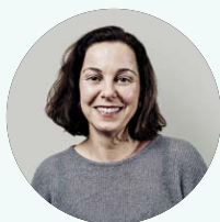
Neus en BCN