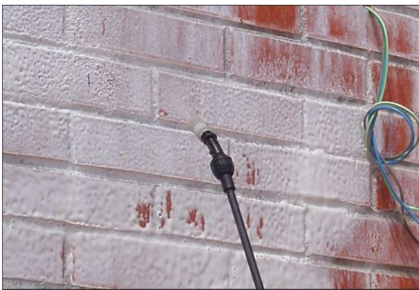
Durante la aplicación

Limpiador antisalitre de fachadas y pavimentos.