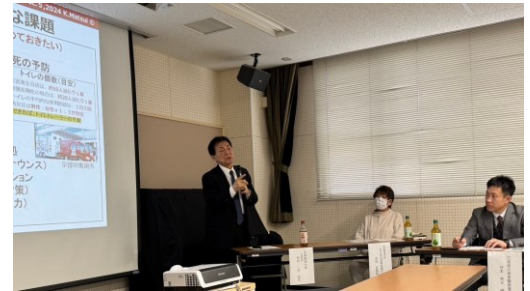
松井 一洋 名誉教授による講演