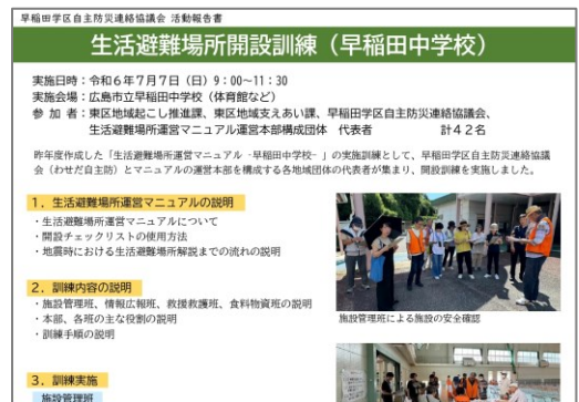
活動報告(R6.7.7生活避難場所開設訓練)