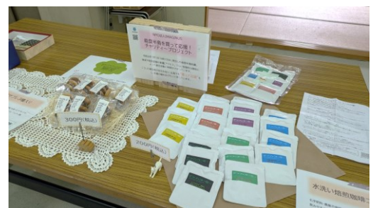
能登半島地震の被災地支援のための物販