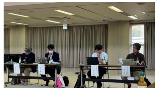
防災フェアへの参加意見（ちゅピCOM）