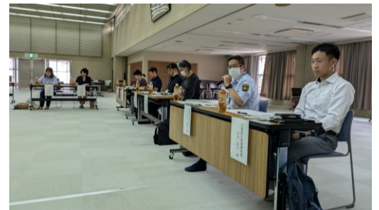
参加者による意見交換（東消防署）