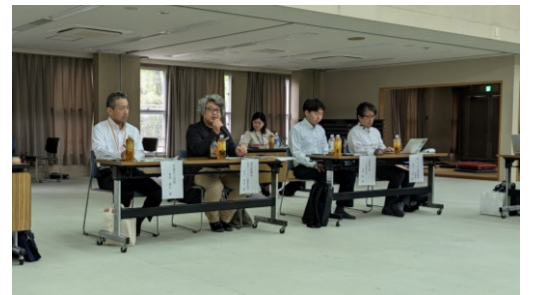
参加者による意見交換（東区医師会）