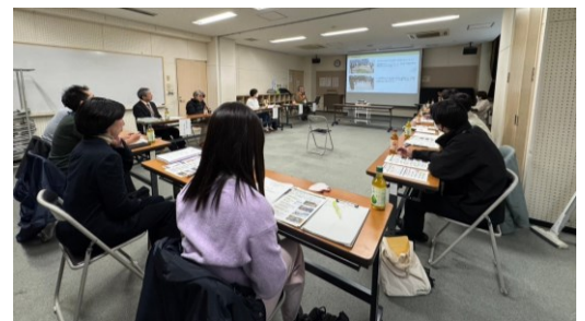
総合避難訓練・防災フェアの結果報告