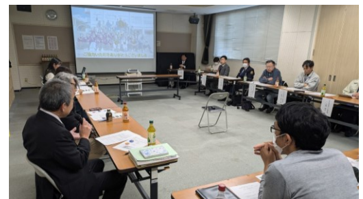
参加者から感想・意見（早稲田公民館）