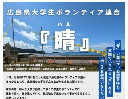
学生ボランティア連合「晴」紹介資料