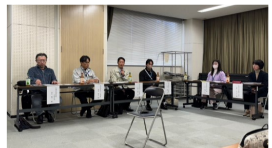
参加者から感想・意見（地域起こし推進課）