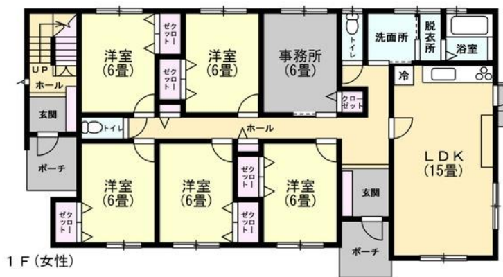
1 F (女性)