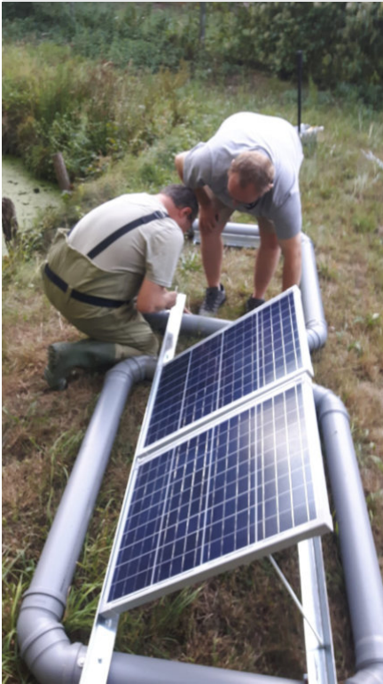
Die Panels sind schon installiert.

Am Anfang hatten wir sie probeweise in Rechtenbach im Aufzuchtteich, aber als dann die Forellen kommen sollten, wurde sie in den Angelteich umgesetzt.