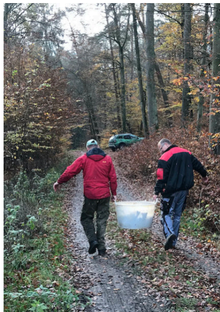
Ganz schön schwer die Fische.