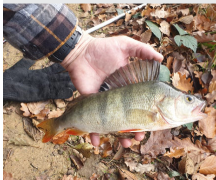
Dieser schöne Barsch konnte in Cleeberg überlistet werden.

Auch für uns ist dieses Jahr alles etwas umständlicher. Corona sei Dank "durften" wir in diesem Jahr schon einige Vorstandssitzungen als Net-Meeting machen - ganz wie die Politiker.