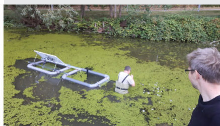
Die Konstruktion schwimmt - wenigstens noch....