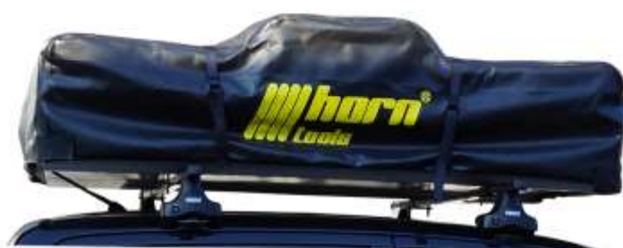
Dachzelt-Abdeckung mit Reißverschluss 120/140cm x 120cm x 40cm Fr. 210.- 165cm x 120cm x 40cm Fr. 250.-