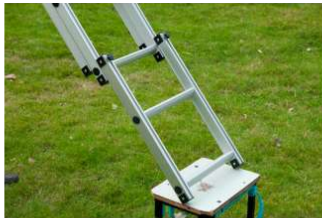
Leiter-Verlängerung um 54cm (geeignet für Offroad Fahrzeuge ab 210cm ) Fr. 75.-