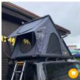
Alu Hartschalenzelt 140cm URANOS 3'800.00 CHF