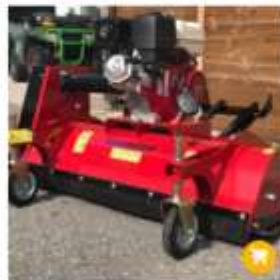
ATV Schlegelmäher Kehrmaster 3'990.00 CHF