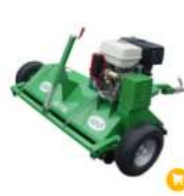
ATV Schlegelmulcher GED AT-120 2'490.00 CHF