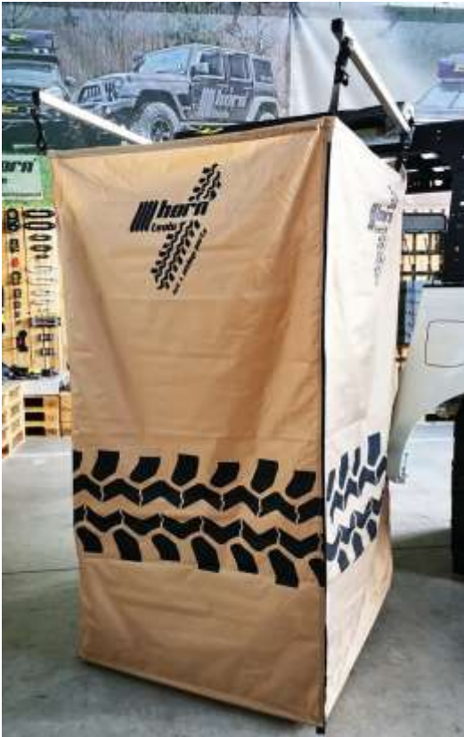
Duschzelt, Badezelt, Duschmarkise, Umkleide, Campingdusche 1,0x1,0m