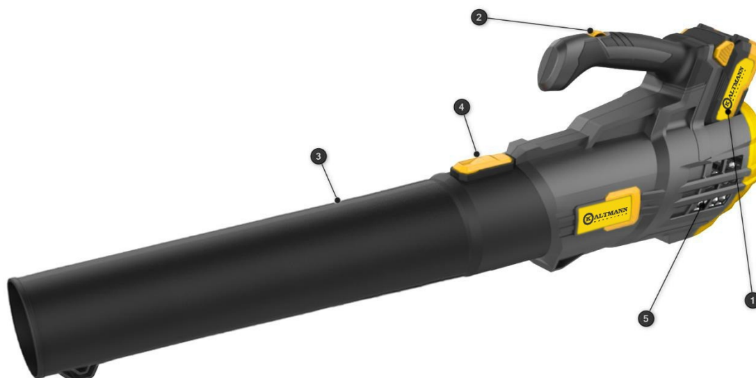
Abbildung 1: Laubbläser